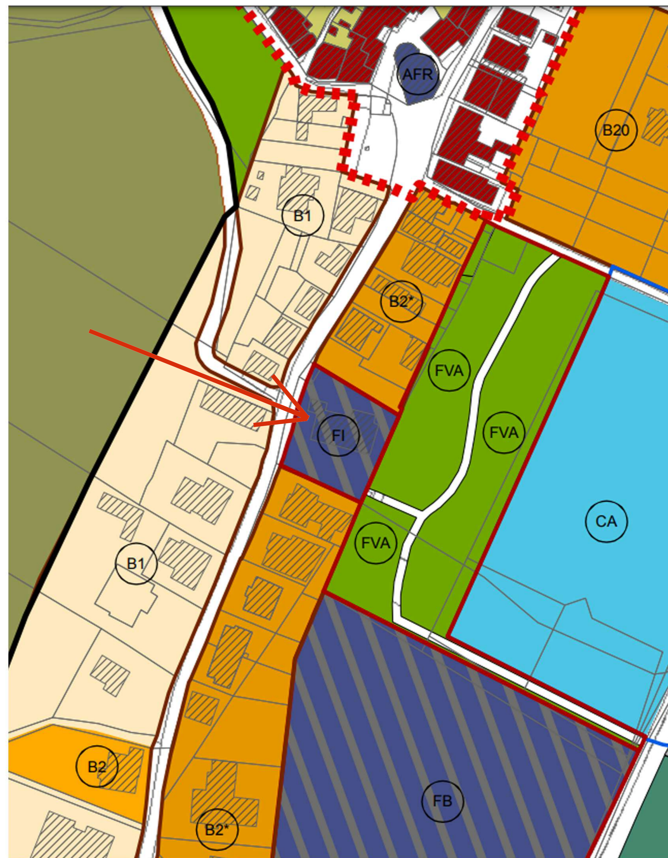
Attuale -Tavola PRG parte operativa fraz. Ripabianca