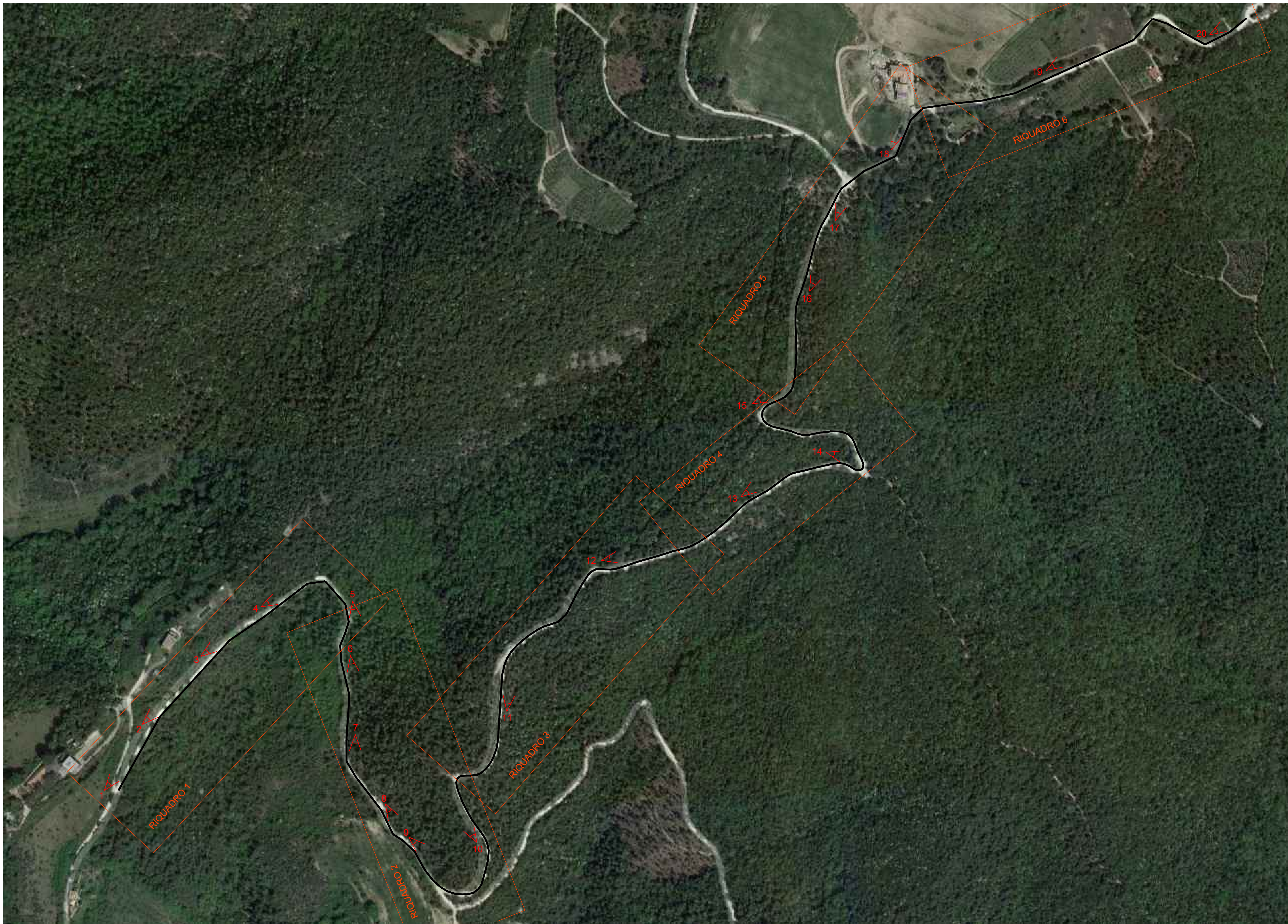
INQUADRAMENTO SU ORTOFOTO SCALA 1:2000