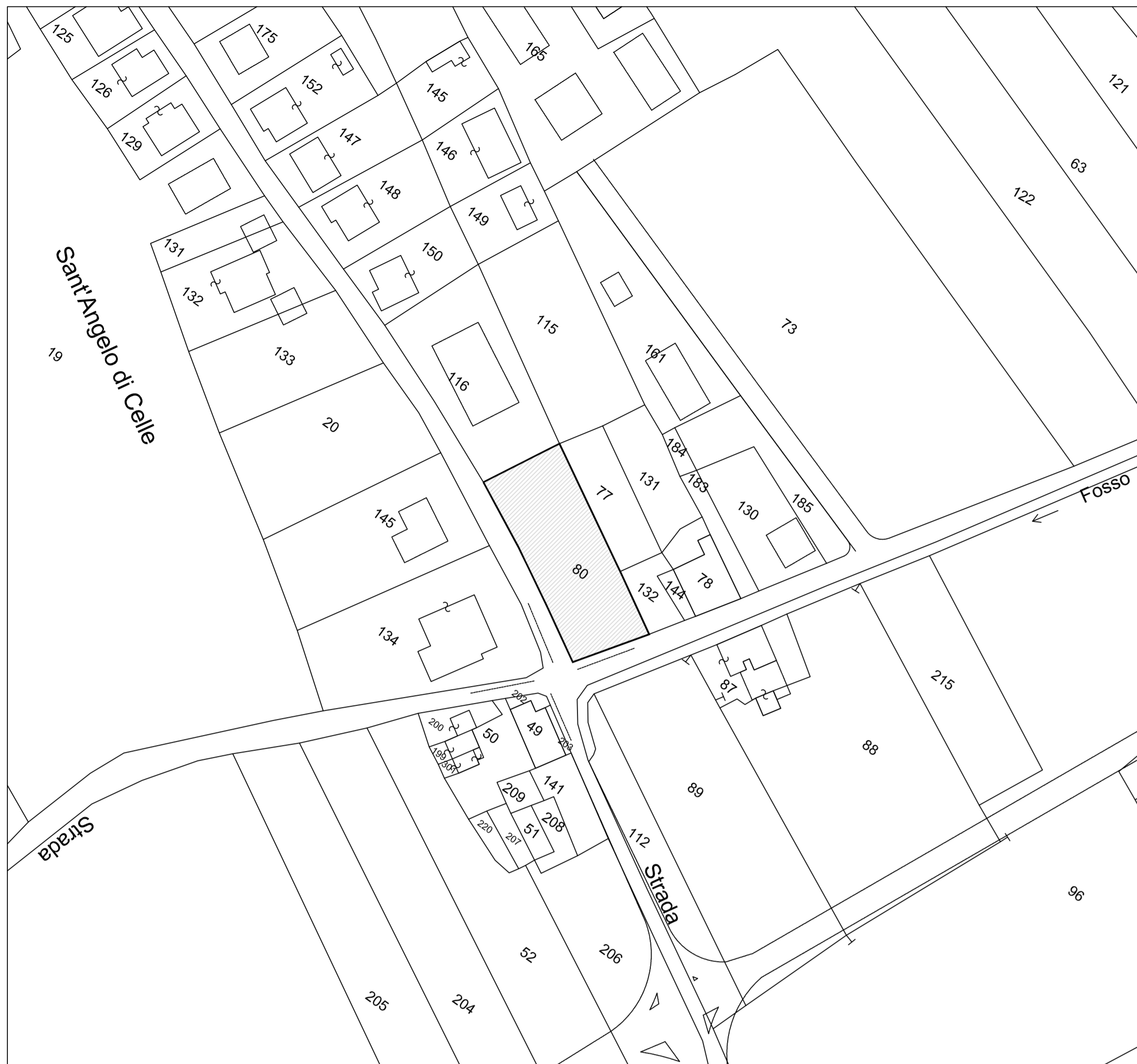
CATASTALE Foglio 15 part.80