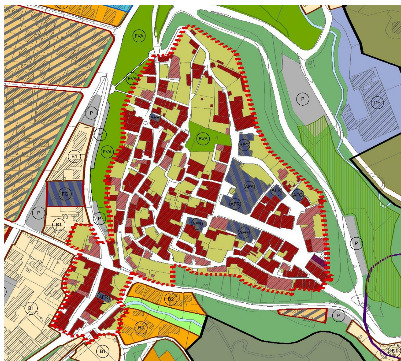
STRALCIO DEL PRG