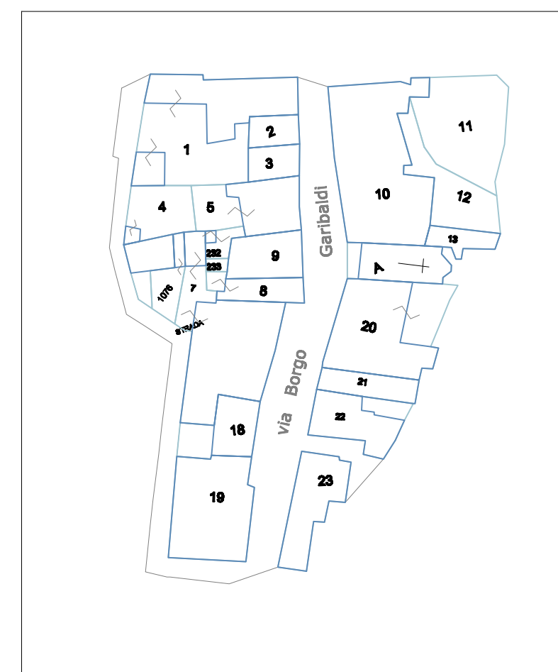
PLANIMETRIA CATASTALE Allegato A del foglio n° 20 1:1000