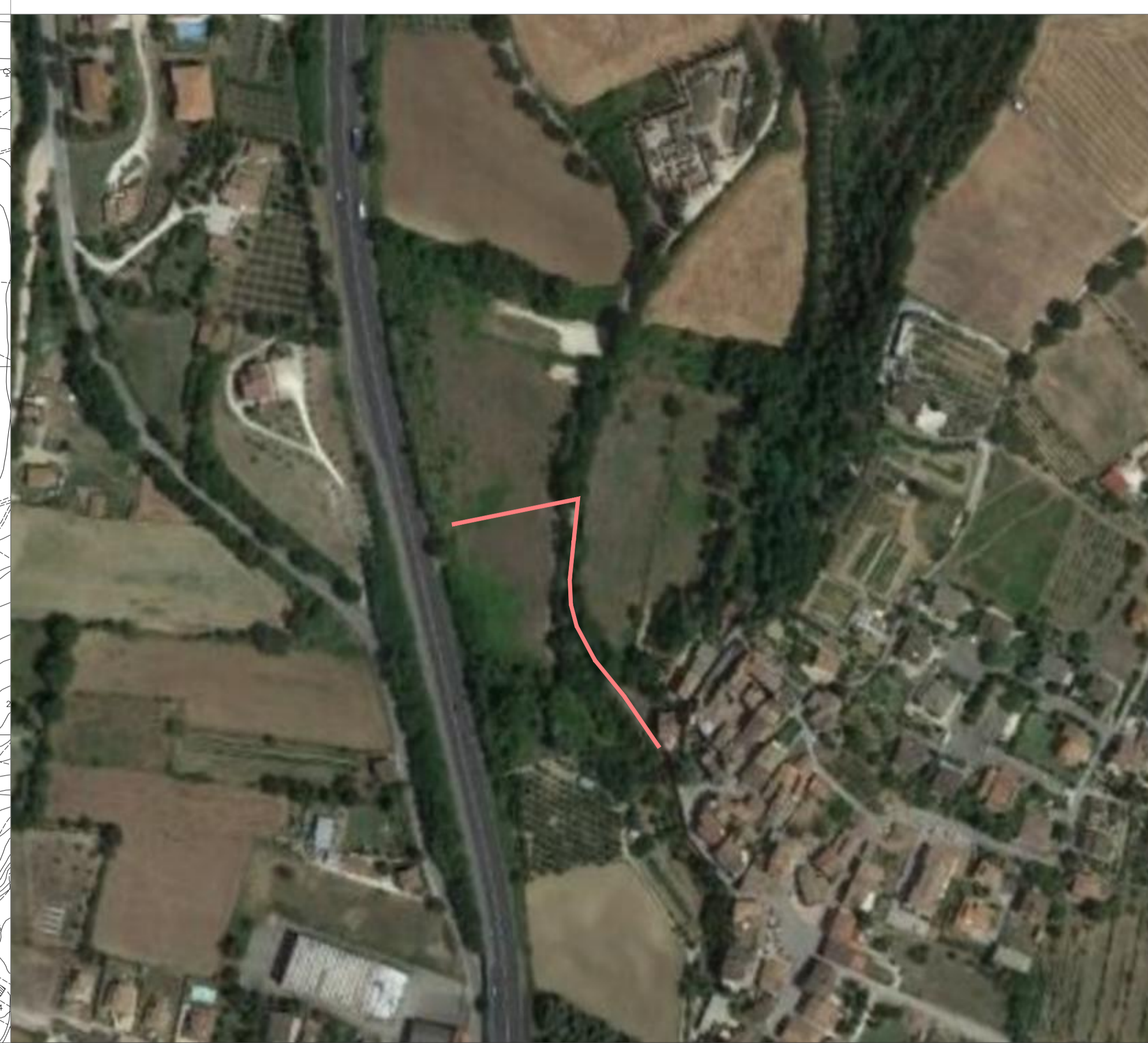
PRG COMUNE DI DERUTA - PARTE OPERATIVA STRALCIO DELLA TAV 5 RIPABIANCA