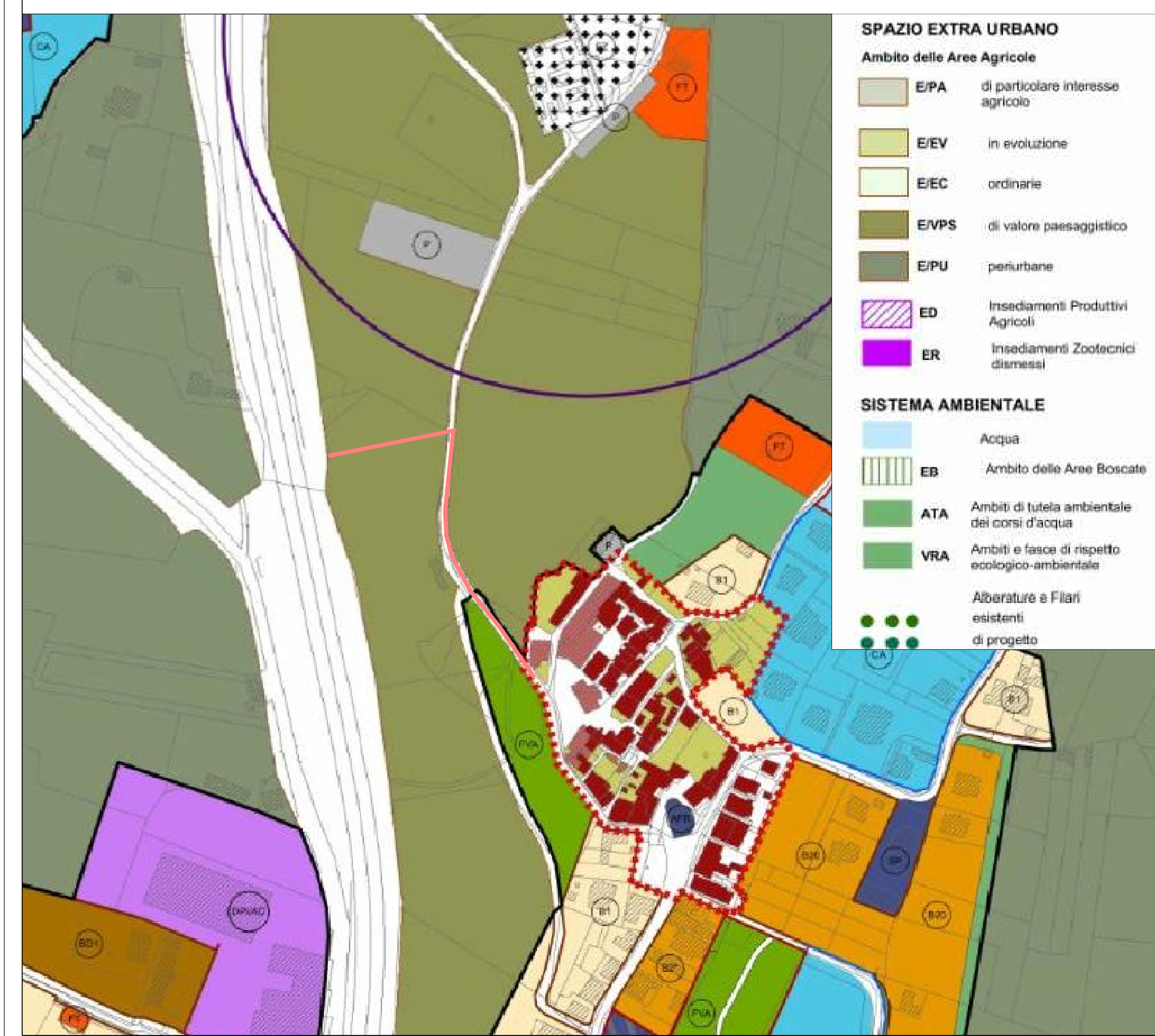
PRG COMUNE DI DERUTA - PARTE STRUTTURALE STRALCIO DELLA CARTA DEI CONTENUTI PAESAGGISTICI